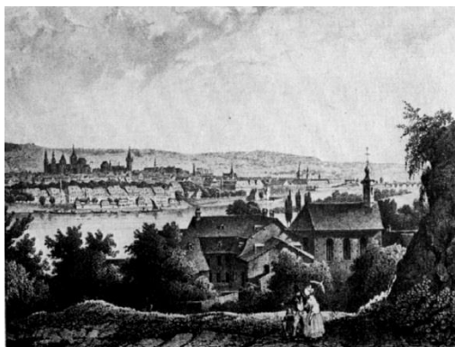
Επάνω αριστερά: η γερμανική πόλη Τριρ (Trier) τον 19ο αιώνα, στο γυμνάσιο της οποίας φοίτησε ο Καρλ Μαρξ. Επάνω δεξιά: πορτρέτο του νεαρού φοιτητή Καρλ Μαρξ.

Ο Μαρξ αρχίζει τον λόγιο βίο του ως ένας, τυπικώς τουλάχιστον, Χριστιανός. Όταν τελείωσε τη μέση εκπαίδευση, στο απολυτήριό του, κάτω από την ένδειξη “Θρησκευτική Γνώση,” γράφθηκαν τα εξής: “Η γνώση του περί τη Χριστιανική πίστη και ηθική είναι αρκούτως σαφής και καλώς θεμελιωμένη. Γνωρίζει επίσης σε κάποια έκταση την ιστορία της Χριστιανικής Εκκλησίας” (για περισσότερες λεπτομέρειες, βλ. Trevor Ling, Karl Marx and Religion: In Europe and India , London: The Macmillan Press Ltd., 1980).