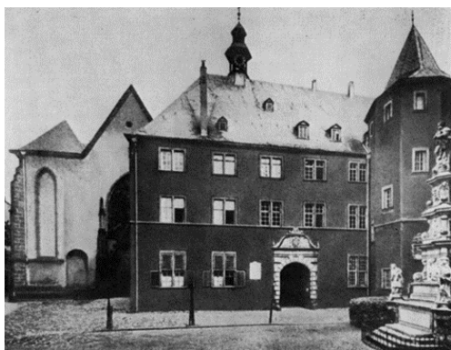
Αριστερά: το γυμνάσιο όπου φοίτησε ο Καρλ Μαρξ στην πόλη Τριρ.