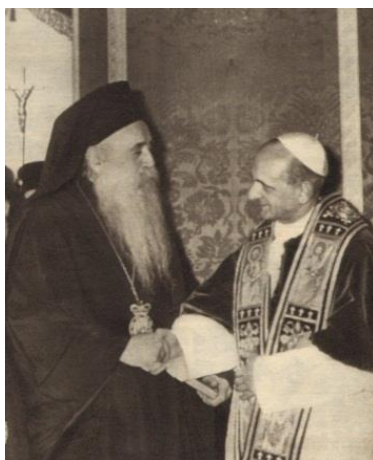
Ο Πατριάρχης Κωνσταντινουπόλεως Αθηναγόρας Α΄ και ο Πάπας Ρώμης Παύλος ΣΤ΄, Ιερουσαλήμ 1964.

Εξαιτίας της προαναφερθείσας αντίδρασης του Στάλιν, ο Αθηναγόρας Α΄ απέτυχε στην αρχική αποστολή του να υπονομεύσει το σοβιετικό καθεστώς μέσω της Ορθοδοξίας, απογοητεύοντας έτσι τους Αμερικανούς υποστηρικτές του, και, γι’ αυτό, σύντομα στράφηκε στο Βατικανό για να αποκτήσει νέα πολιτικά ερείσματα, προωθώντας μια πολιτική συμφιλίωσης μεταξύ της Ανατολικής Ορθόδοξης Εκκλησίας και του Ρωμαιοκαθολικισμού, κυρίως με κοσμικά κριτήρια και όχι τόσο με θεολογικά. Το 1964, στην Ιερουσαλήμ, συναντήθηκαν ο Πατριάρχης Κωνσταντινουπόλεως Αθηναγόρας Α΄ και ο Πάπας Παύλος ΣΤ΄ και ήταν τα αναθέματα του 1054, τα οποία ιστορικά σηματοδοτούν το λεγόμενο “Μέγα Σχίσμα,” δηλαδή, τη διαίρεση και διάσπαση της κοινωνίας μεταξύ της Δυτικής Εκκλησίας και της Ανατολικής Εκκλησίας όταν επικεφαλής τους ήταν, αντιστοίχως, ο Πάπας Ρώμης Λέων Θ΄ και ο Πατριάρχης Κωνσταντινουπόλεως Μιχαήλ Κηρουλάριος, χωρίς όμως ο Πατριάρχης Κωνσταντινουπόλεως Αθηναγόρας Α΄ και ο Πάπας Παύλος ΣΤ΄ να έχουν προηγουμένως επιλύσει τις θεολογικές διαφορές που προκάλεσαν το σχίσμα του 1054 και την πνευματική απόκλιση μεταξύ της Δυτικής και της Ανατολικής Εκκλησίας η οποία επακολούθησε το σχίσμα του 1054.