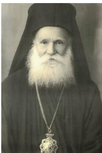
Ο πρώτος προκαθήμενος των παλαιοημερολογιτών της Ελλάδας, Μητροπολίτης πρώην Φλωρίνης Χρυσόστομος (Καβουρίδης)

Η αντίδραση του νεοημερολογίτη Μητροπολίτη Αθηνών Χρυσόστομου υπήρξε άμεση και βίαιη. Έστρεψε αμέσως την κυβέρνηση εναντίον των τριών ενιστάμενων